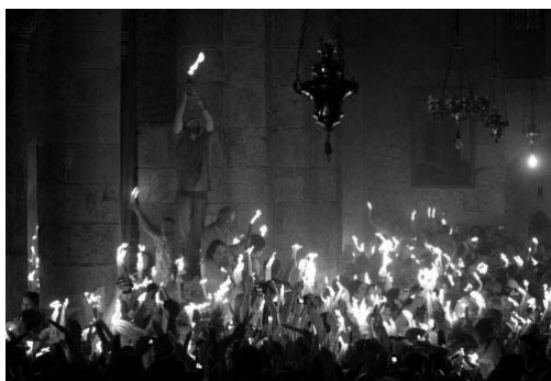
Schádzanie Blahodatného ohňa

snemoch prostredníctvom svätých otcov rozhodla, že Pascha a iné cirkevné sviatky sa nemajú slúžiť s Židmi, inovercami a neveriacimi. Duch tohto pravidla spočíva v tom, aby sa veriaci neovplyvňovali svetskými spôsobmi sviatkovania, ale aby vedeli, že cirkevné, pravoslávne sviatky sú niečím celkom iným – duchovným a svätým a aby sa podľa toho aj správali. Juliánsky kalendár je teda nie všemocná a najdôležitejšia, ale predsa len veľmi užitočná pomôcka k tomu, aby veriaci