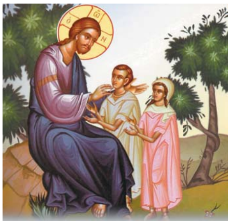
Macocha - mama

Olinkina mama bola dlho chorá a ležala v nemocnici. Raz k nej otec priviedol Oľgu. Ledva spoznala svoju mamu, taká bola chudá a bledá. Mama na ňu dlho pozerala, hladkala ju po hlave a na rozlúčku povedala, že Olinka musí byť múdre dievčatko a vo všetkom má pomáhať otcovi. Viac už Oľga mamu nevidela. Povedali jej, že zomrela. Žila spolu so svojím otcom. Spočiatku bolo všetko dobré, otec chodil s Oľgou do detského parku, večer ju zobral a bol s ňou skoro celý čas: čítal jej rozprávky, porozprával zaujímavé príhody a volal ju maličkou gazdinou vo veľkom dome.